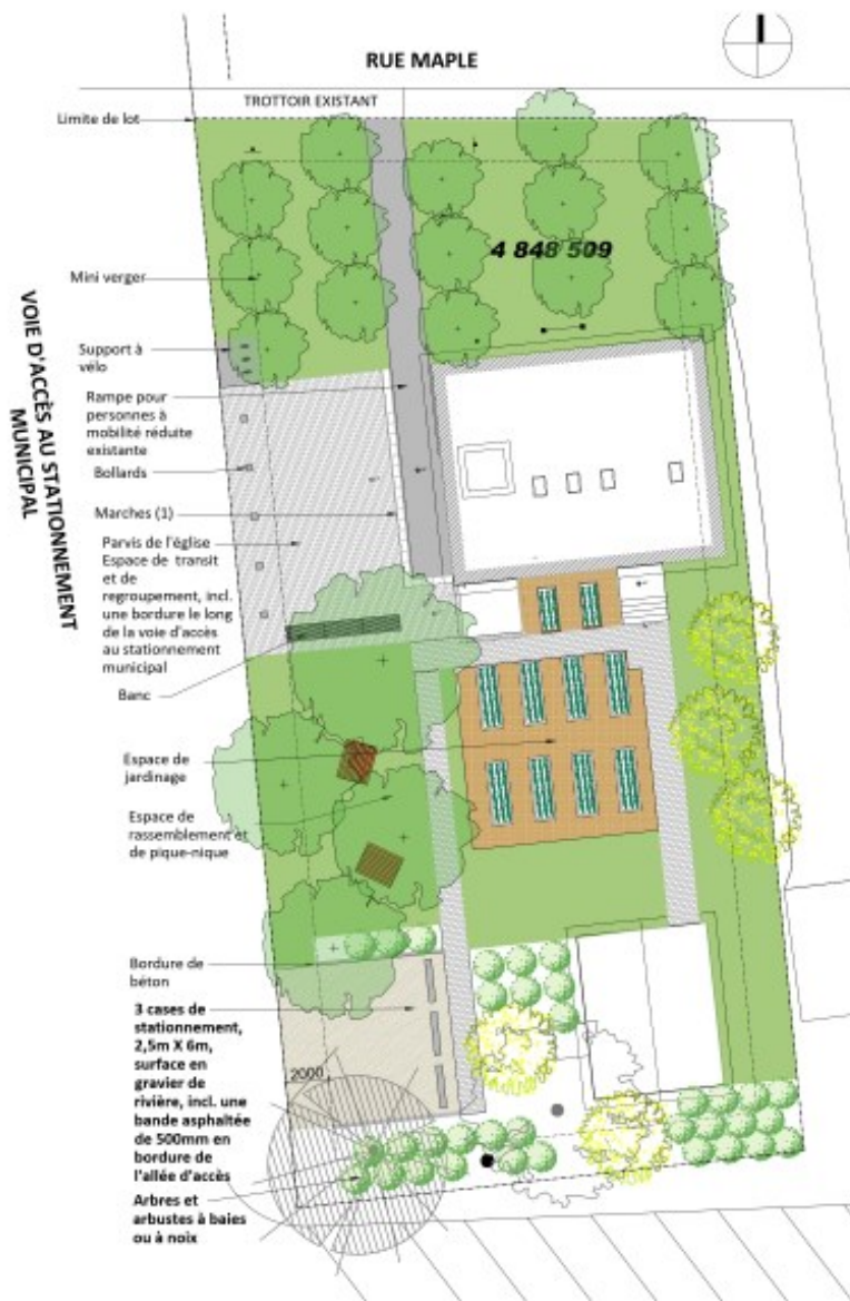
MAISON DES GÉNÉRATIONS - AMÉNAGEMENT EXTÉRIEUR Concept d'aménagement du stationnement - Option A

CONSIDÉRANT les principaux critères de décisions suivants devant guider la décision d'accorder ou non une dérogation mineure :