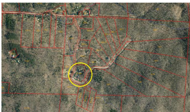
LOCALISATION : CHEMIN DRIVER

CONSIDÉRANT QU'une demande de modification d'un plan d'implantation et d'intégration architecturale (P.I.I.A.) relative à des travaux d'agrandissement d'un bâtiment accessoire situé au 842 chemin Driver a été présentée;