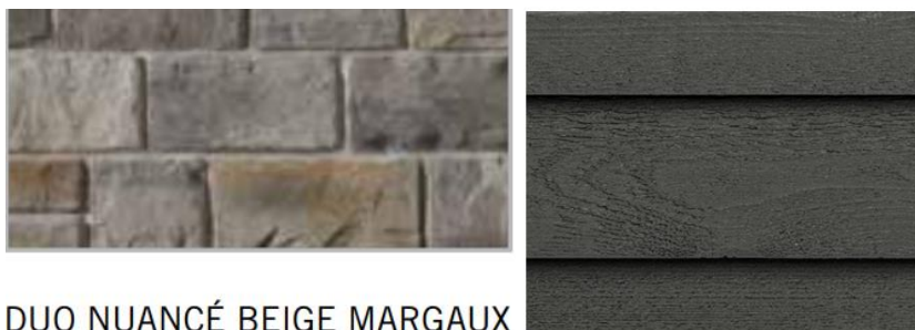
DUO NUANCÉ BEIGE MARGAUX ET NUANCÉ GRIS CHAMBORD GRIS SABLON MATÉRIAUX PROPOSÉS

CONSIDÉRANT QUE le revêtement extérieur du bâtiment actuellement jaune serait peint de la couleur gris sablon et que la façade ouest serait recouverte de pierres artificielles d'un mélange de couleur nuancé beige Margaux et nuancé gris Chambord ;