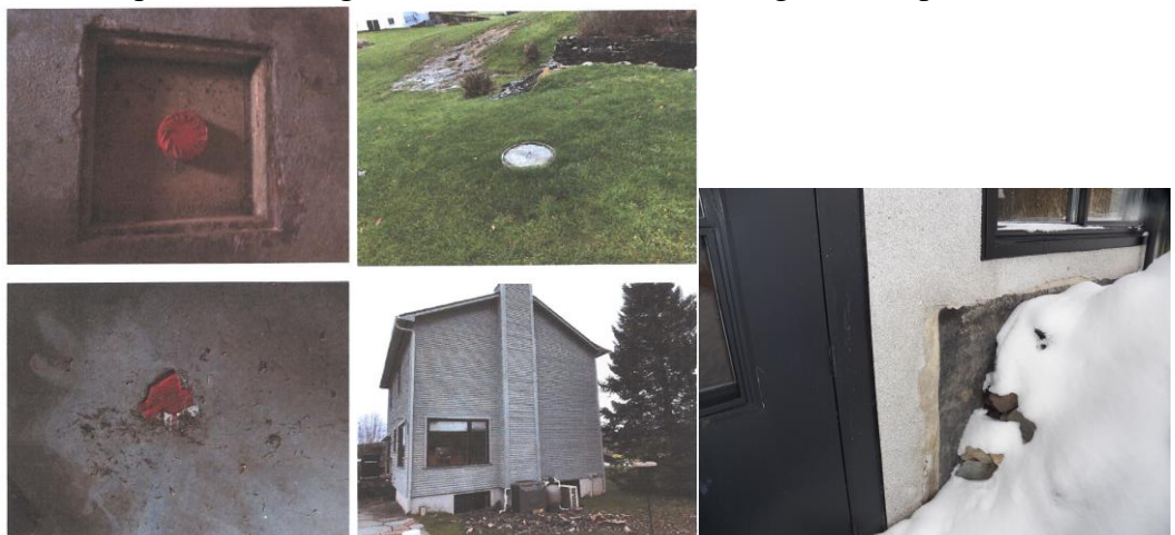
DÉLABREMENT DU BÂTIMENT

CONSIDÉRANT QUE les membres jugent des problématiques d'infiltration d'eau, des problèmes d'égout, de fondation et de drainage décrits par le demandeur;