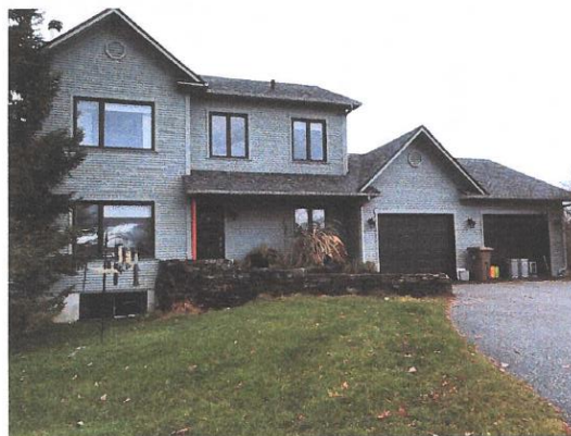
BÂTIMENT VISÉ PAR LA DEMANDE

CONSIDÉRANT QUE la demande vise à démolir un bâtiment résidentiel de type unifamilial isolé, ainsi que la reconstruction d'une résidence unifamiliale isolée, en 2020;