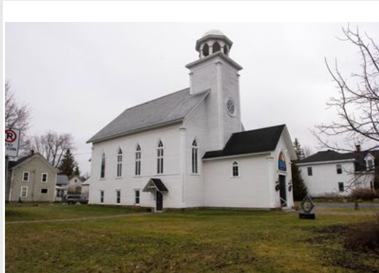
Église Calvary en 2015