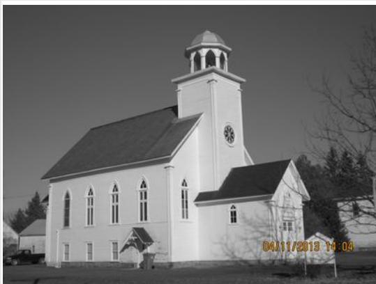
Église Calvary en 2013