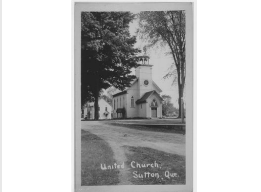
United Church avant 1949 (3)