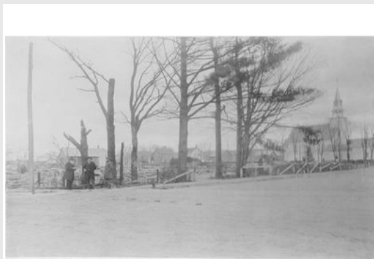
Sites of Drs Cutter & MacDonald after 1898 fire