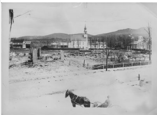
United Church (spire) & Olivet Baptist Church after